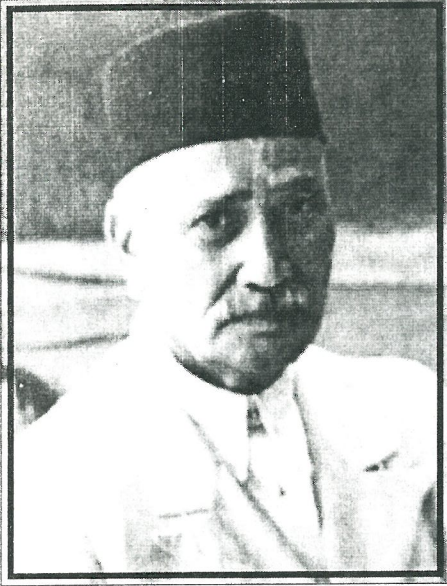
જ્ઞાતિ રત્ન દાનવીર રા. રા. (સ્વ.)